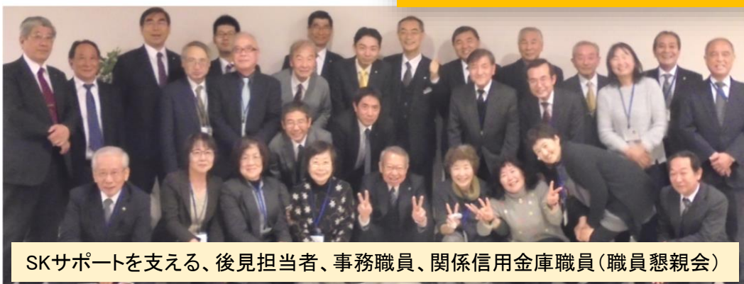
SKサポートを支える、後見担当者、事務職員、関係信用金庫職員(職員懇親会)