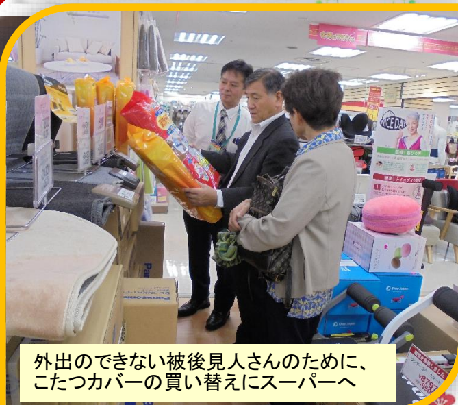
外出のできない被後見人さんのために、 こたつカバーの買い替えにスーパーへ